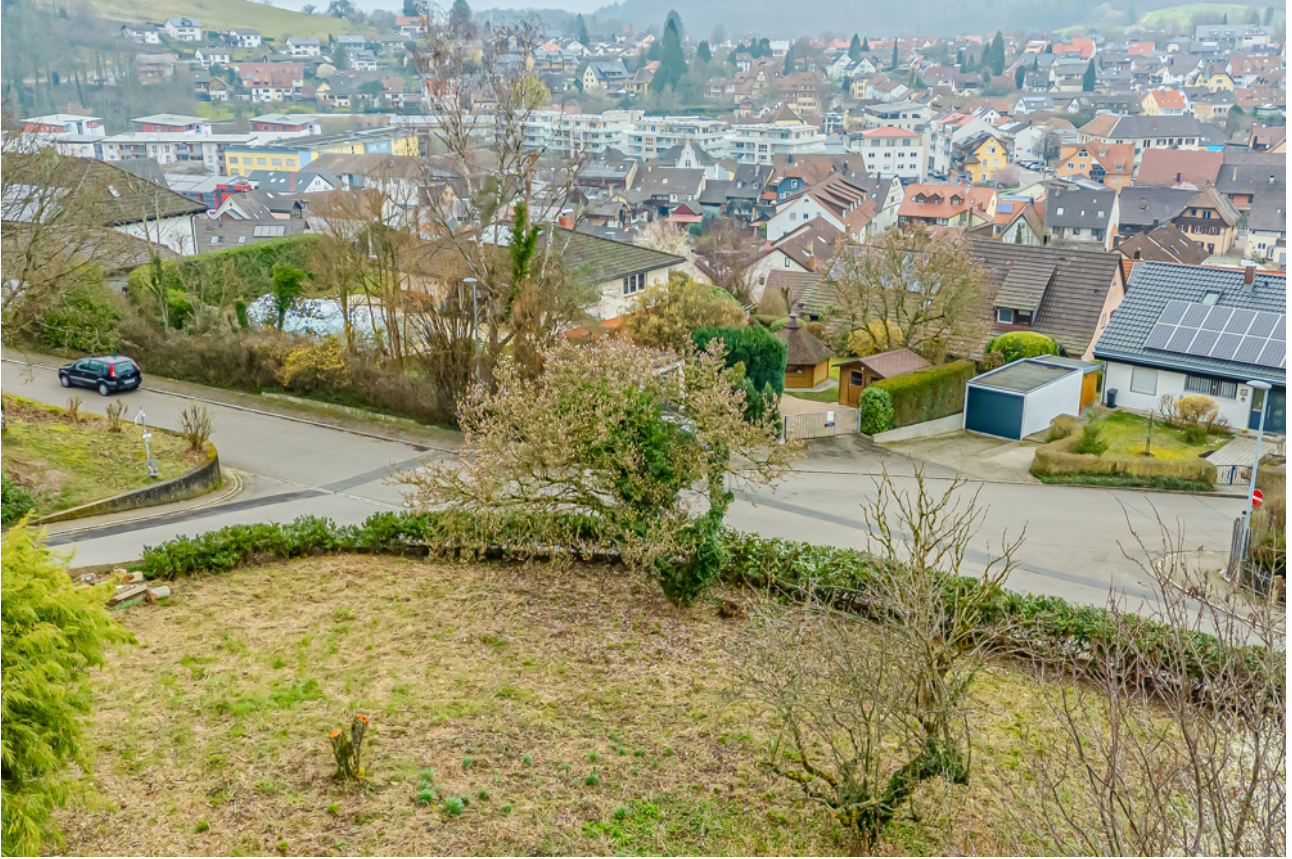
Aussicht auf Kandern