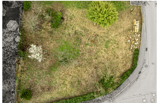
Das gesamte Grundstück